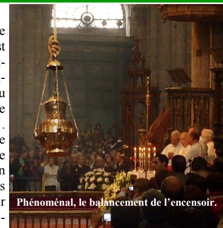
Phénoménal, le balancement de l'encensoir.