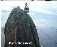
Pain de sucre

2009 est dense en pays visités : Grèce, Chine, Italie, Espagne, Portugal, Suisse, Maroc, Brésil.