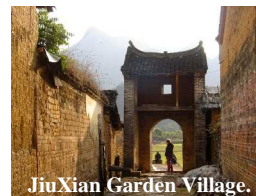
JiuXian Garden Village.

Avez-vous noté que la page 3 du bulletin est traditionnellement consacrée au fait le plus marquant ou le plus imagé de l'année écoulée ? Les N° 16 et 17 pour 2008 et 2009 abordaient l'Asie avec le mariage de Pascal et l'inauguration de la retraite en Thaïlande et en Chine. Le présent bulletin poursuit la saga asiati-