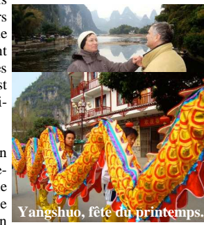
Yangshuo, fête du printemps.

Le puzzle des 5000 pièces en bois de la maison de thé est reconstitué. Le jardin se meuble progressivement et le village accueille ses premiers ateliers en décembre.